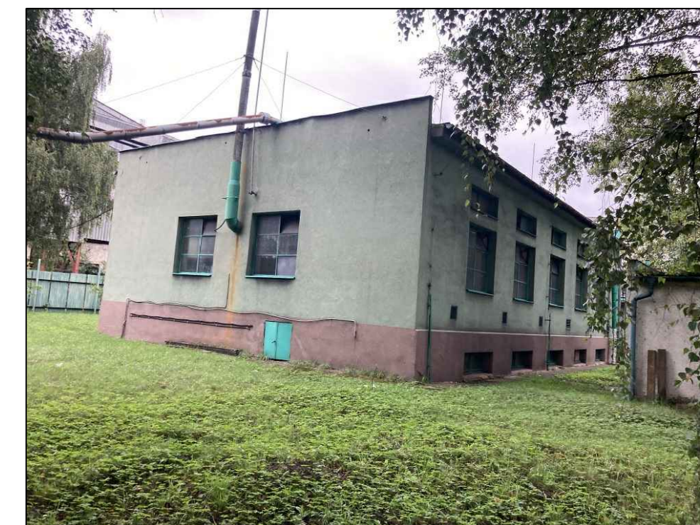
POHLED Z J-Z STRANY